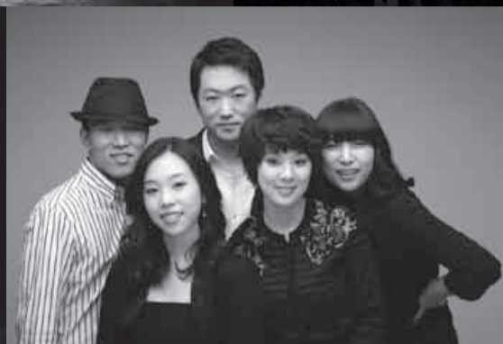
Cool a Capella