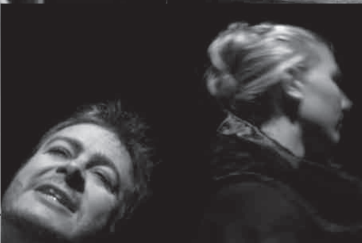
Ums `n Jip